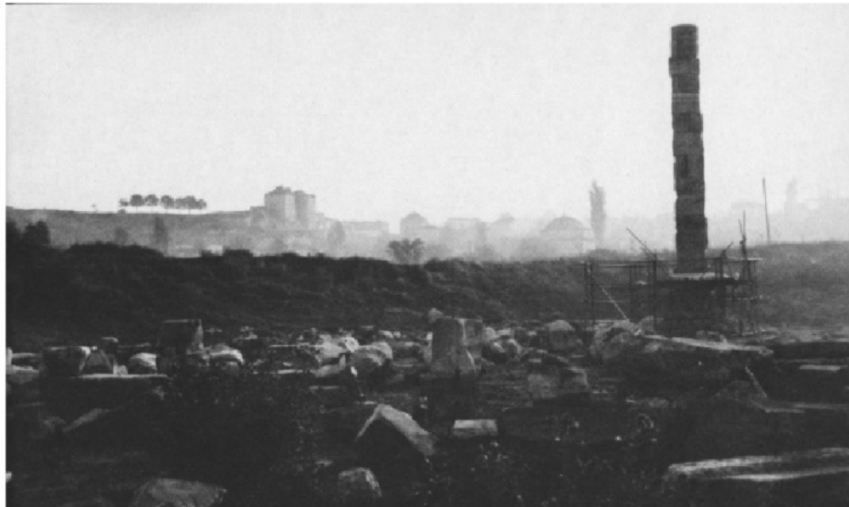
Abb. 1: Der Tempel der Artemis von Ephesos heute